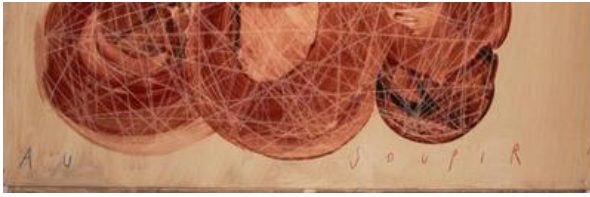
Arpaïs Du Bois, 'Dans la chambre à murmures', Be-Part Waregem.